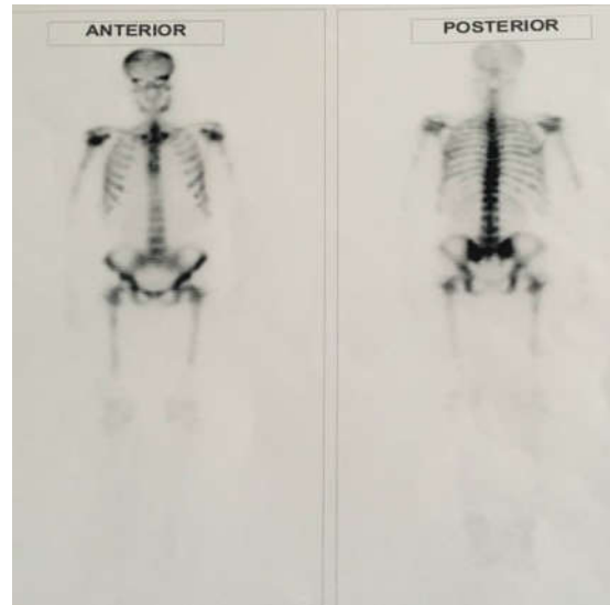
شکل ۱. اسکن استخوان با استفاده از تکنسیوم ۹۹م که افزایش جذب در اسکلت استخوانی را نشان می‌دهد.

کنترل نسبی هیپوکلسمی در نهایت با پیشرفت بیماری و درگیری منتشر پریتون و ضایعات متاستاتیک ریوی در فاز نارسایی تنفسی فوت کردند.