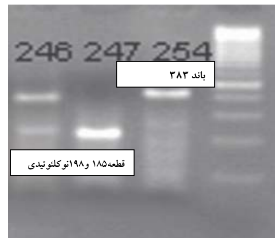
شکل ۲. RFLP با آنزیم HPYCH4III از چپ به راست: سایز مارکر ۱۰۰ (ladder)، ۲۵۴ ژنوتیپ C/C، ۲۴۷ ژنوتیپ T/T، ۲۴۶ ژنوتیپ C/T

فراوانی الل T و C به ترتیب در گروه شاهد ۴۲٪ و ۴۸٪ و در گروه بیمار ۳۰٪ و ۷۰٪ بود. توزیع ژنوتیپی و الی پلی مورفیسیم ژن miR-196a-2 rs11614913 در دو گروه بیمار و شاهد در جدول ۲ نشان داده شده است. بر اساس نتایج این مطالعه ارتباط معنی داری بین ژنوتیپ TT و احتمال کاهش ابتلا به سرطان دیده شد (نسبت شانس ۰/۴، فاصله اطمینان ۹۵ درصد (p=۰/۰۳؛ ۰/۱۷-۹۲/۰).