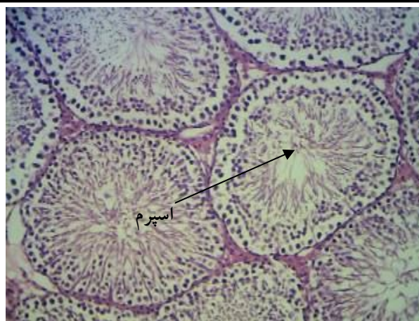
شکل 2- بافت بیضه در گروه دریافت کننده 2000mg/kg گوشت میوه نارگیل (هماتوکسیلین - ائوزین، بزرگنمایی 40x)

بدین وسیله از مسئولان و کارکنان محترم دانشگاه آزاد اسلامی واحد کازرون، دانشکده پزشکی، دامپزشکی و آزمایشگاه تشخیص طبی دکتر قوامی شیراز صمیمانه سپاسگزاری می‌شود.