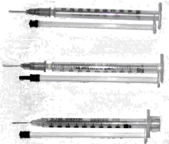
شکل ۱- انواع سرنگ‌های انسولین مورد مطالعه. از بالا به پایین: اطلس سرنگ، سرنگ V MED، سرنگ SOHA.

است (۲). بنابراین رقیق کردن فرم‌های دارویی موجود در بخش‌های نوزادان رایج است. وسایل مورد استفاده برای کشیدن و رقیق کردن داروها در طب نوزادان خصوصاً در زمان تجویز وریدی باید از حجم ثابت و دقت کافی برای تعیین حجم‌های بسیار کم (در حد صدم میلی‌لیتر) برخوردار باشد. به همین دلیل معمولاً برای تجویز داروها به نوزادان از سرنگ‌های یک میلی‌لیتری (با نام رایج سرنگ انسولین) استفاده می‌شود. حجم واقعی داروی کشیده شده توسط این سرنگ‌ها پس از رقیق کردن ممکن است با حجم اسمی (که از طریق محاسباتی برای به دست آوردن مقدار مشخص دارو تعیین شده است) متفاوت باشد. یکی از مهم‌ترین دلایل این تفاوت (نادرستی حجم اسمی) وجود فضای مرده در سرنگ است (۳). فضایی مخروطی شکل در محل اتصال سر سوزن به سیلندر سرنگ‌ها وجود دارد و خط صفر درجه‌بندی سرنگ بعد از آن قرار می‌گیرد؛ بدین ترتیب حجم مایعات داخل این فضا در حجم اسمی سرنگ که با درجه‌بندی روی بدنه سرنگ مشخص می‌شود در نظر گرفته نمی‌شود (شکل ۱).