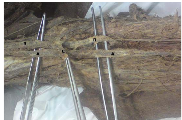
شکل ۲- قسمت تحتانی بازو، حفره آرنجی و قسمت فوقانی ساعد، A: شریان رادیال، B: شریان اولنار که امتداد شریان بازویی است، C: ورید مدیان کوبیتال

سپس عضله سینه‌ای کوچک از مبداء دنده‌ای جدا گردیده و به سمت بالا برگردانده شد تا شریان زیربغلی مشخص شود. به منظور بررسی دقیق‌تر شریان، ورید زیربغلی قطع و کنار زده شد. پس از بررسی شریان زیربغلی و شاخه‌های آن مشاهده شد که شریان رادیال از بخش دوم شریان زیربغلی بلافاصله پس از تنه توراکوآکرومیال منشعب شده بود و شاخه‌های قسمت سوم شریان